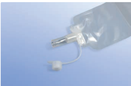
Konnektor für Ablaufbeutel