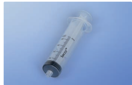
Einwegspritze, 45 ml