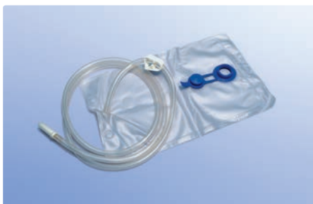
Irrigationsbeutel 2.000 ml, steril