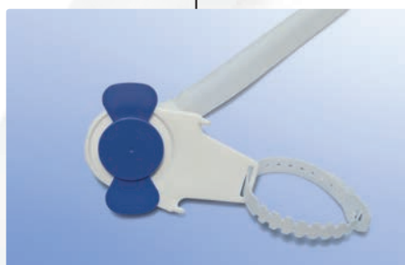
Aufsatzplatte mit Wechselschluss und Aufhängeband