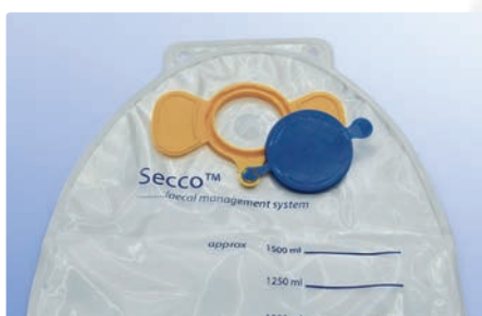
Geruchshemmende Filter auf Beuterrückseite

Secco Protect™ ist mit einer einzigartigen Superabsorber-Technologie zur Bindung von infektiösen flüssigen Fäkalien ausgerüstet. Es verhindert beim Sammeln und beim Entsorgen des Stuhlganges die Verbreitung von infektiösem Material. Die einzigartige EasyFlush Oberfläche verhindert Schlauchverklebungen und hält effektiv Gerüche zurück.