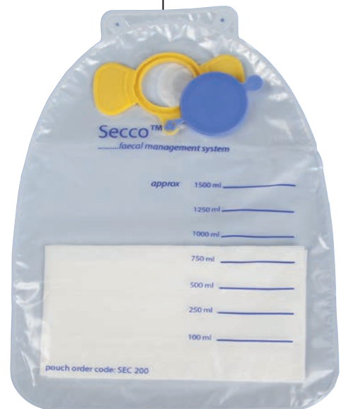
1.500 ml Auffangbeutel mit Superabsorber