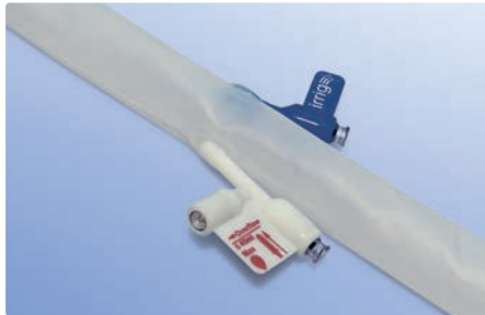
Blau: Irrigationskonnektor Weiß: Konnektor für Retentionsballon mit integriertem Druckentlastungsventil