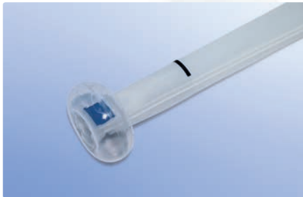
Niederdruck-Retentionsballon und Katheter-Lokalisierungsmarkierung