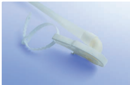
Aufsatzplatte mit Aufhängeband