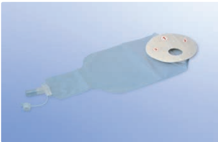
Fäkal-Kollektorbeutel, selbstklebend, mit Konnektor für Ablaufbeutel