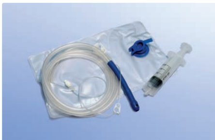
Irrigationsset geschlossen, mit Ventil, steril