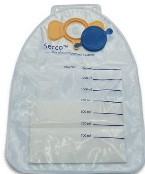
1.500 ml Auffangbeutel mit Superabsorber