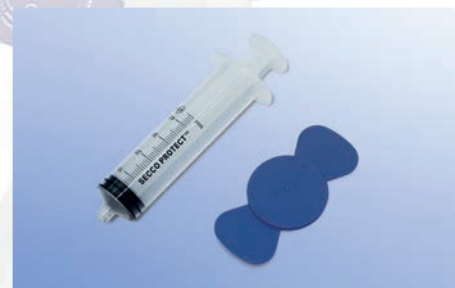
Einwegspritze, 45 ml Wechselschluss für Aufsatzplatte