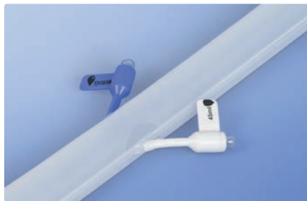
Irrigations (blau)- und Retentionskonnectoren (weiß)