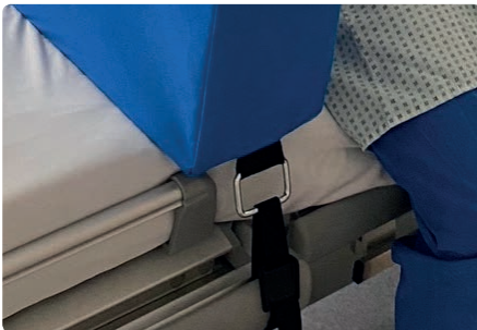
Befestigung am Krankenbett

Der Mobilisations-Sitz dient als Unterstützungshilfe zur Frühmobilisierung von Patienten. Er wird auf ein vorhandenes Patientenbett befestigt und kann individuell an den Patienten angepasst werden. Zur einfacheren Handhabung sind die Armlehnen klappbar. Das mitgelieferte Zubehör kann für verschiedenste Krankenhausausstattungen angepasst werden.